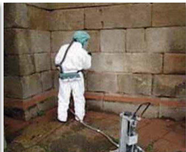
Limpieza de fachada