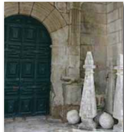
Pináculos después de la restauración