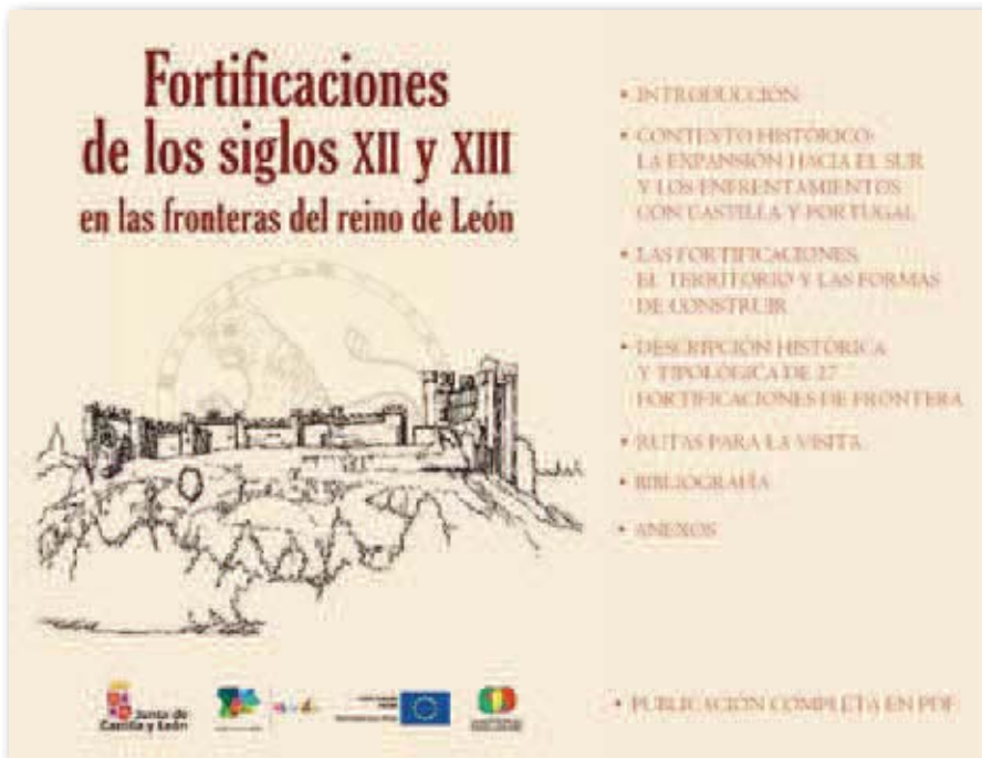
Portada de la publicación digital