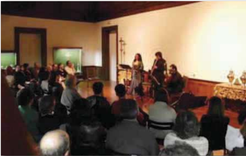
Primera edición "Comassos da História 2012" en el Museo de Lamego