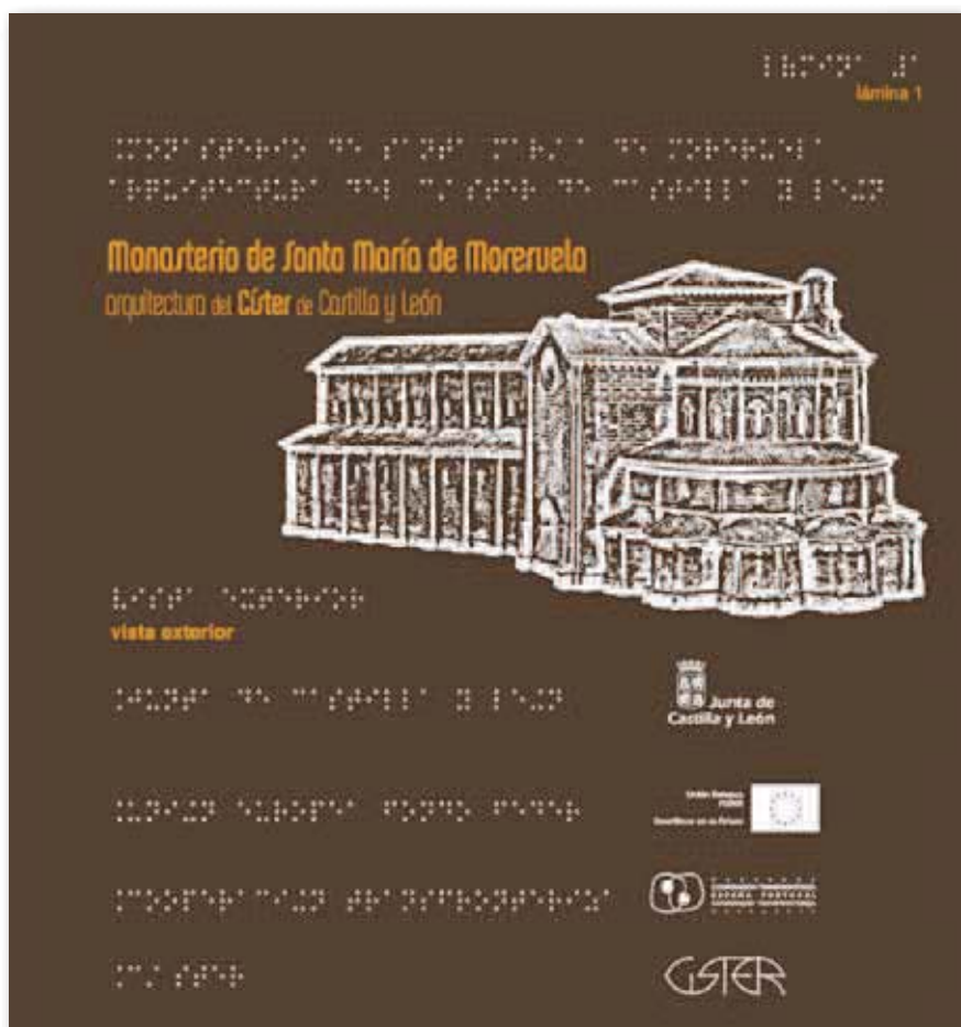
Portada del libro Monasterio de Santa María de Moreruela

- La edición de materiales para discapacitados visuales sobre el monasterio cisterciense de Santa María de Moreruela, en la provincia de Zamora. Consistente en un publicación con gráficos y textos en relieve sobre el Monasterio de Santa María de Moreruela (Zamora) y las locuciones correspondientes al mismo.