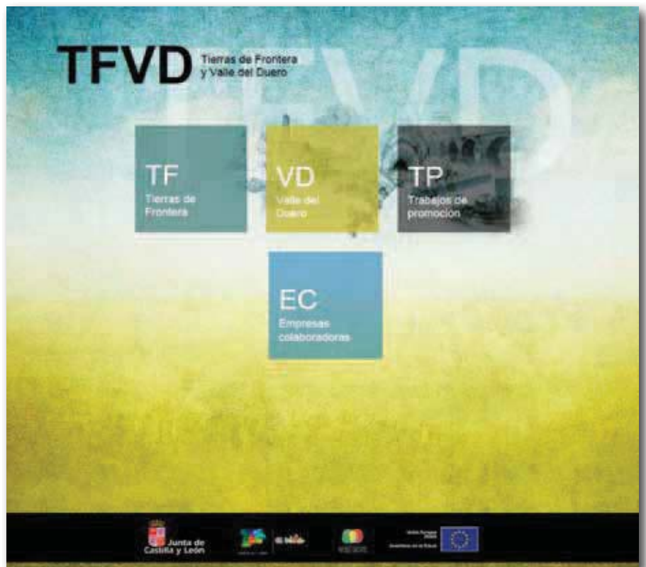
Interface del interactivo