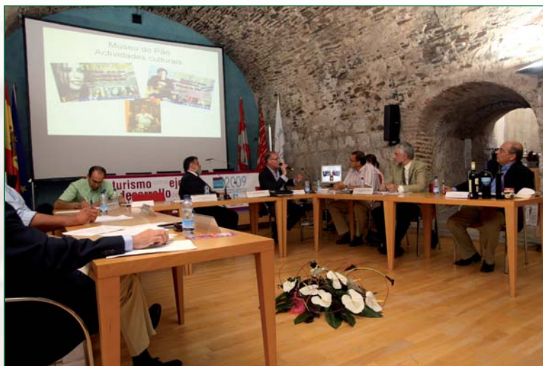
Participantes en la mesa de "Productos de calidad" (3 de junio de 2009).