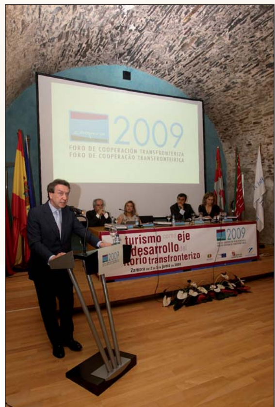
Inauguración del Foro Coopera 2009, celebrado en la sede de la FRAH - Fundación Rei Afonso Henriques de Zamora, a cargo del Consejero de la Presidencia de la Junta de Castilla y León (2 de junio de 2009).

Estos ámbitos de debate recibieron un tratamiento más especializado en mesas específicas, en las que intervinieron decenas de especialistas, agentes políticos, económicos, sociales y culturales de ambos lados de la frontera. Se pusieron en común casos concretos con aspectos relevantes para las tres regiones implicadas (Castilla y León, Región Centro y Región Norte de Portugal), algunos de los cuales eran fruto de la cooperación transfronteriza.