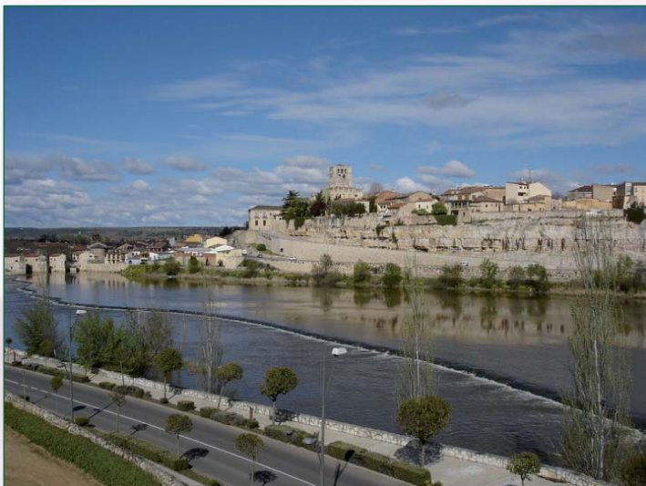
Vista de la ciudad de Zamora desde la sede de la FRAH - Fundación Rei Afonso Henriques.