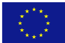
Unión Europea Fondo Europeo de Desarrollo Regional Invertimos en su futuro