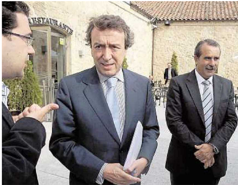
El consejero de la Presidencia, junto al delegado territorial de la Junta en Salamanca