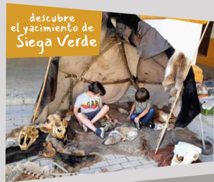
descubre el yacimiento de Siega Verde

Actividades libres hasta completar el aforo