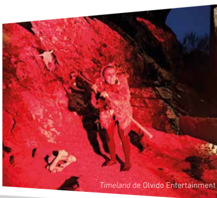
TimeLand de Olvido Entertainment